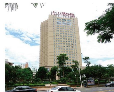
厦门中山医院内科病房大楼